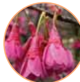
■カンヒザクラ 日本庭園、下の池