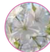
■オオシマザクラ 旧洋館御休所近く