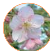
■カワヅザクラ 管理事務所近く