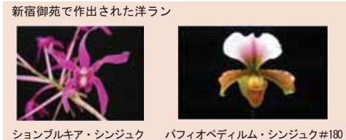
新宿御苑で作出された洋ラン

また、戦前に御苑で作出された洋ランや野生ラン(原種)などの保護栽培を進めるとともに、生活と関わりの深い熱帯植物の魅力を楽しむ空間づくりも目指します。