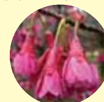
カンヒザクラ 3月中旬