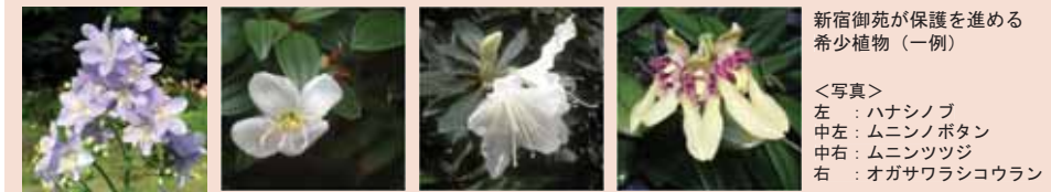
新宿御苑が保護を進める希少植物(一例)

新温室では、絶滅のおそれのある植物の保護のために特別な栽培施設を備えるなど、絶滅危惧植物の保護拠点としての機能の充実に取り組みます。