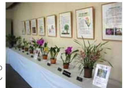
シオンブルキア・シンジユク パフィオペディルム・シンジユク#180

新温室オープンまでの間、温室で栽培している植物の一部については、エコハウスの展示コーナーでご紹介します。季節の花々をお楽しみください。