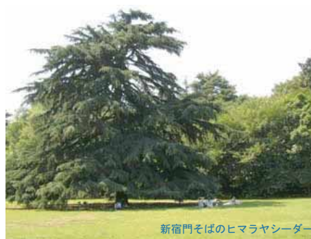
新宿門そばのヒマラヤシーダー