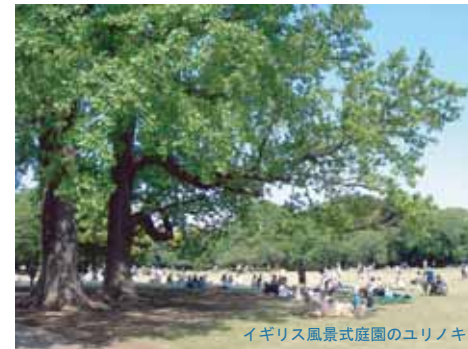
イギリス風景式庭園のユリノキ