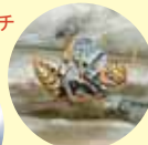
セグロアシナガバチ