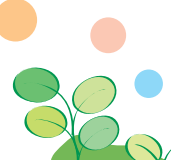
タイサンボク (泰山木) モクレン科・常緑高木 5月下旬~7月上旬