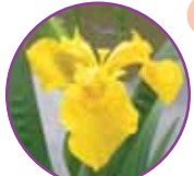
キショウフ (黄薑蒲) アヤメ科・多年草 5月上旬~6月中旬