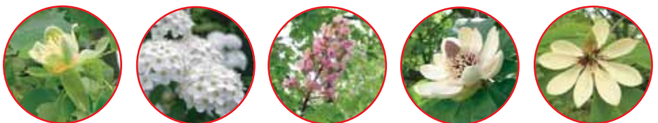
ユリノキ (百合の木) モクレン科・落葉高木 4月下旬~5月中旬 コテマリ (小手繰) バラ科・落葉低木 4月下旬~5月上旬 ベニバナトチノキ (紅花栴の木) トチノギ科・落葉高木 4月下旬~5月上旬 ホオノキ (朴の木) モクレン科・落葉高木 4月下旬~5月中旬 ウケザキオオヤマレンゲ (受天大山蓮華) モクレン科・落葉高木 4月下旬~5月中旬

花々の甘い香りに包まれる5月の新宿御苑。 みどりまぶしい新緑の園内で、憩いのひとときを お楽しみください!