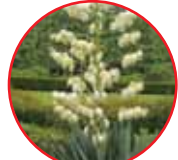
アツバキミガヨラン (原葉君代蘭) ユリ科・常緑低高木 5月中旬~5月下旬