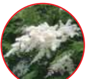
ニクナナカマド (庭七草) バラ科・落葉低木 5月下旬~6月中旬