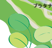
コテマリ (小手繰) バラ科・落葉低木 4月下旬~5月上旬