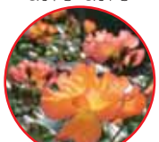
バラ (薔薇) バラ科・常緑低木 5月中旬~7月下旬