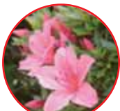
サツキ (早月) ツツジ科・常緑低木 5月中旬~6月上旬