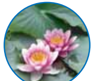
スイレン (睡蓮) スイレン科・水生植物 5月中旬~9月中旬