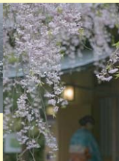
2008新宿御苑フォトコンテスト入賞作品（敬称略）