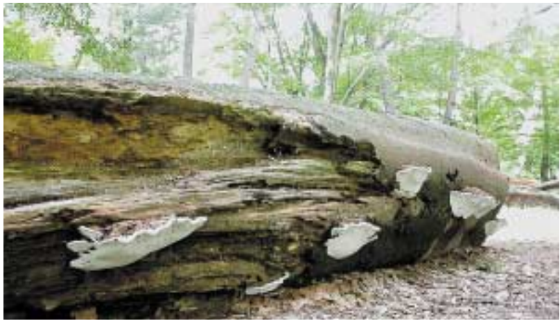
巨木に発生するコフキササルノコシカケ

京都御苑は四季折々多様なきのこを観察することができ、市街地の広大なビオトープです。毎年発生を繰り返すきのこに出会うたびにその季節を実感し、自然の循環を感じることができ、樹木と共生する菌根菌、倒木や落葉を分解する木材腐朽菌が一年中活動を続けています。 京都御苑の北東方向に位置する「母と子の森」では巨大な広葉樹の倒木が置かれていて、その材の観察を続けていると季節ごとにいろいろなきのこが発生しているのことが観察できる。観察ができません。晩秋から冬の間には見事なヒラタケやアラゲキクラゲ、ヒラタケなどは担子菌類です。担子器という器官の先端に胞子をつけ、成熟すると一瞬で