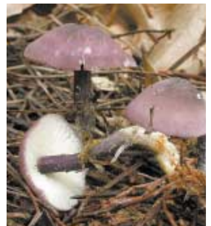
昨年11月に観察したヒメムラサキシメジ

コフキササルノコシカケやアラゲキクラゲ、ヒラタケなどは担子菌類です。担子器という器官の先端に胞子をつけ、成熟すると一瞬で